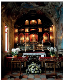
La cappella delle beate Caterina e Giuliana