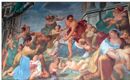
Antonio Busca, «La strage degli innocenti» (particolare)

chissime rappresentazioni della vergine, lo stato verginale «era visto come un medium di trascendenza dei limiti tra la natura e il soprannaturale, tra il dentro e il fuori, tra il proprio e l'estraneo, tra l'uomo e la donna». A proposito di Giuliana è anche documentata la sua dedizione ai poveri: offriva loro acqua e ristoro e «si impegnò con tanta sollecitudine e gioia che arrivò a trascorrere più di 200 notti vegliando nel parlatorio da dove si distribuiva l'acqua». Ancora oggi una