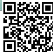
Il codice Qr per scaricare l'app gratuita de «L'Osservatore Romano»

A cento anni dalla nascita di Giovanni Paolo II, lunedì 18 maggio, alle 7, Francesco celebrerà la messa sulla tomba del Pontefice santo nella basilica Vaticana.