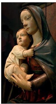
Madonna lignea del Santuario di Macereto (XV secolo)

lità indiscussa, come l' Annunciazione e Cristo in pietà di Giovanni Angelo d'Antonio, pittore che probabilmente raffigura se stesso nel dettaglio della foto riprodotta in pagina, e scruta lo spettatore come a volerlo coinvolgere nella scena di morte e redenzione che si sta svolgendo sul Golgota.