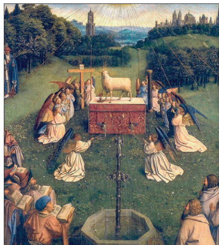
Adorazione dell'Agnello (particolare)

Finora mi sono riferito alla vista della politica quando è aperto. Ma anche quando i due pannelli laterali sono chiusi a coprire il pannello centrale, si è sconvolti dalla bellezza