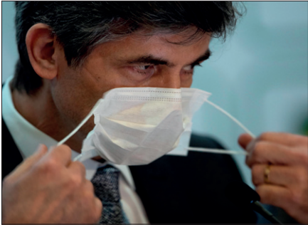
Il ministro dimissionario durante una conferenza stampa

Il Paese è il più colpito dalla pandemia nella regione e nella graduatoria globale dei contagi è sesto. Il totale dei casi positivi, con gli oltre 15.000 registrati ieri, ha superato le 220.000 unità e le vittime complessive sono quasi 15.000, con oltre le 800 morti conteggiate nelle ultime 24 ore. Secondo il ministero della Sanità sono poi ancora da accertare le cause che hanno portato al decesso di altre 2.000 persone.