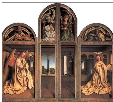
La parte superiore del Polittico chiuso

Il messaggio non vuole significare che solo alcuni saranno salvati, sfuggendo alla massa dannata. Una cosa sorprendente: qui non si vede nessun dannato. Proprio come nel Giudizio finale di Rogier van der Weyden all'Hotel-Dieu di Beaune o in quello di Memling a Danzica. Là, il Cristo è anche attorniato da Maria e da Giovanni Battista, in atteggiamento di preghiera perché supplicano per i peccatori. Qui, Maria e Giovanni hanno un libro in mano. Non si tratta più di supplicare. Tutto è compiuto. Non sono unicamente alcuni che possono essere salvati. Si tratta, come viene detto in maniera così forte nell' Apocalisse : «Dopo ciò, apparve una moltitudine immensa, che nessuno poteva contare, di ogni nazione, razza, popolo e lingua. Tutti stavano in piedi davanti al trono e davanti all'Agnello» (7,9).