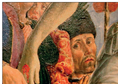
Giovanni Angelo d'Antonio, «Annunciazione e Cristo in pietà» (1455, particolare)

«Questo per noi è segno di gioia e speranza» ha detto l'arcivescovo di Camerino - San Severino Marche Francesco Massara,